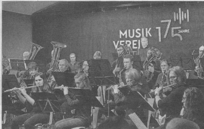
Die Musiker des Musikvereins Wittnau in festlichem Schwarz

Georg Friedrich Händel komponierte die „Feuerwerksmusik“ 1748 als Auftragsarbeit für den englischen König Georg als passende Musik für eine riesige Feier mit großem Feuerwerk. Die Ouvertüre in ihrer dreiteiligen Da-capo-Form zog in ihren Bann, das Adagio erinnerte an eine feierli-